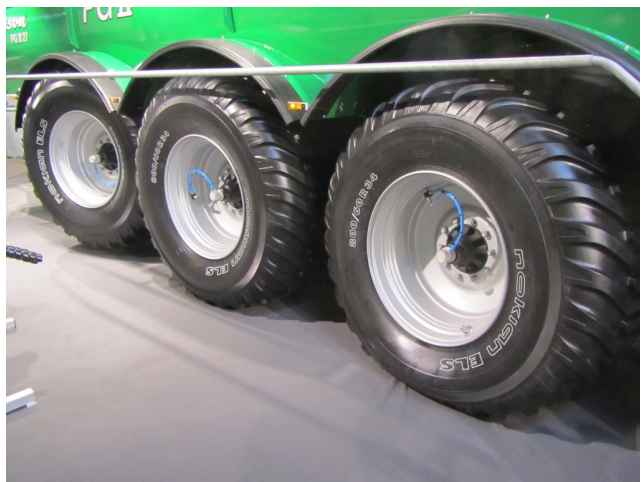
Billede 3. Montage af et system til dæktryksregulering sænker brændstofforbruget og minimerer strukturskader.