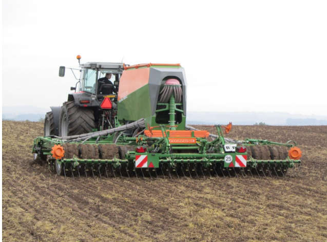
Billede 7. Pløjefri etablering.