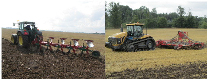
Billede 1 og 2. Hvordan opnås det mindste samlede brændstofforbrug?