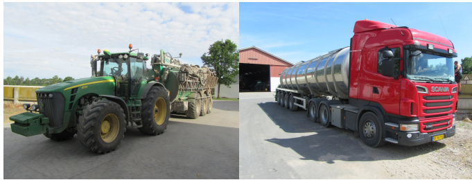
Billede 5 og 6. Transport med lastbil bruger mere end 5 gange mindre brændstof end transport med traktor. Moderne gearkasser af Vario-typen minimerer dog dette væsentligt.